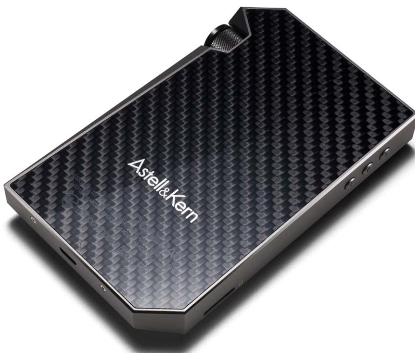
Das Gehäuse-Rückteil des AK240 wird aus Kohlenfaser hergestellt

Beim Gehäusematerial hat Astell&Kern nochmals etwas 'drauf gelegt: Es besteht aus Duralumin, einer besonders hochwertigen, kupferhaltigen Aluminiumlegierung. Das Rückteil des AK240 wird aus Kohlenfaser hergestellt - das ist schon eine Schau. Was ist in dieser edlen Verpackung? Zunächst einmal eine größere Batterie mit - laut Hersteller - circa zwei Jahren Lebensdauer, für die hauptsächlich die Gehäusehöhe benötigt wird. Wie bei den anderen Modellen kann die Batterie des AK 240 nicht selbst getauscht werden, Astell&Kern verspricht diesbezüglich jedoch schnellen Service zu geringen Kosten. Aufgeladen wird der AK240 ganz bequem per USB über den Computer, mit handelsüblichen 2A-Adaptoren