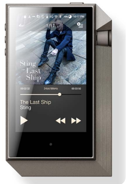
Das große, in der Helligkeit regulierbare Farb-Display ist hervorragend lesbar

kann der Ladevorgang beschleunigt werden.