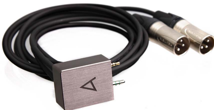
Dieses Adapterkabel ermöglicht den symmetrischen Anschluss an Verstärker mit XLR-Eingängen

3. Der AK240 wird als Laufwerk erkannt und in einem Finder-Fenster dargestellt. Jetzt lässt sich Musik wie gewohnt, zum Beispiel einfach per Drag and Drop, aus dem Quellordner auf den AK240 überspielen